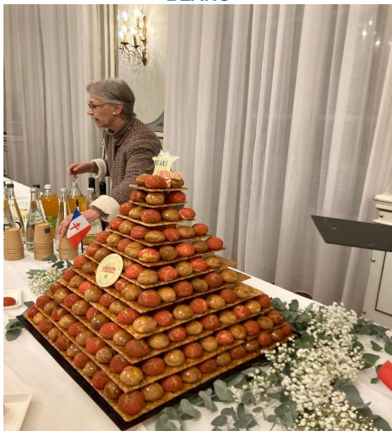
PIECE MONTEE AUX COULEURS DE LA LIBERATION ET DE LA SMLH