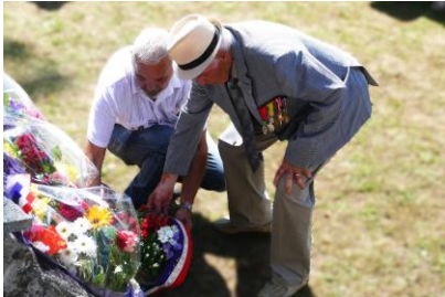
L'ANCIEN PRÉSIDENT DE SECTION A DEPOSE UNE GERBE AU NOM DU COMITE.

- Le 24 août 2024 , une cérémonie a eu lieu devant le monument du Maquis du Secteur VI Grésivaudan Belledonne aux Adrets.